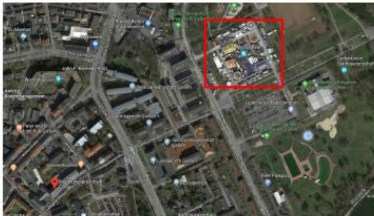
„Parkplatz „Messeplatz“, über die Ringallee zu erreichen

Da die maximal zulässige Parkdauer vor dem Hauptgebäude am Landgraf-Philipp-Platz 1 – 7 in 35390 Gießen limitiert ist, empfehlen wir Ihnen auf die ebenfalls kostenpflichtigen Parkplätze „Zeughaus“ oder „Messeplatz“ auszuweichen.