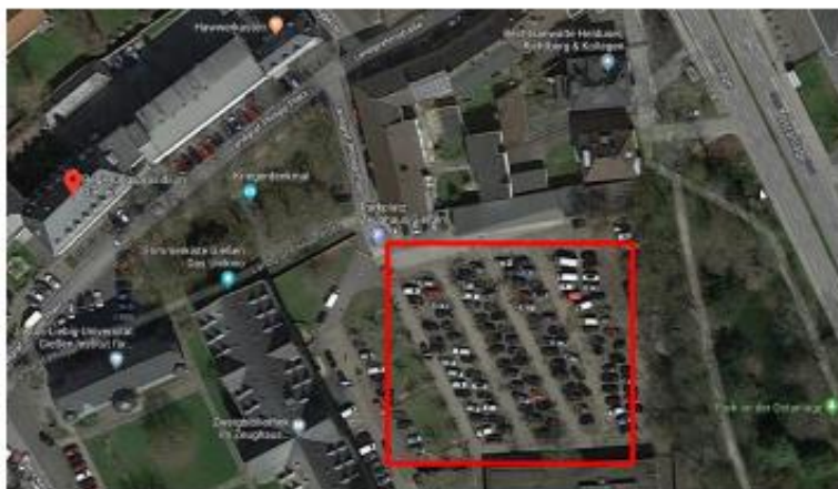
„Parkplatz Zeughaus“, über die Landgrafenstraße und den Landgraf-Philipp-Platz zu erreichen